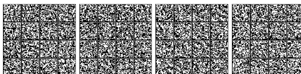
Tabella V.7-3: Livello di prestazione per controllo dell'incendio